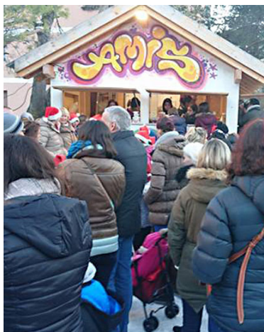
"La Cabane" autour de laquelle AMIS organise de nombreuses fêtes et des animations pour les enfants de la Planchette